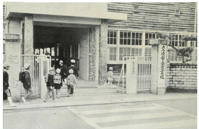
1976年（昭和51年）の国安小正門付近